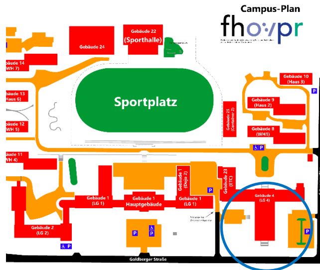
Festsaal im LG 4